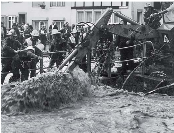
Bild 2. Die Feuerwehr von Lufingen im Einsatz.

erkannt und mit geeigneten Vorkehrungen minimiert werden. Alarmierung und Evakuierung, Objektschutz sowie Versicherungen zur Deckung von Schäden sind zentrale Elemente im Umgang mit Restrisiken.