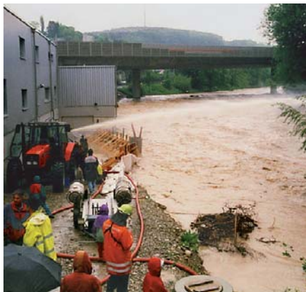
Bild 1. Die Töss mit Hochwasser.

Ein vollständiger Schutz gegen Hochwasser ist nicht möglich. Seltene Grossereignisse führen zu einer Überlastung der für ein bestimmtes Schutzziel ausgelegten technisch-präventiven Massnahmen. Die damit verbundenen Restrisiken müssen