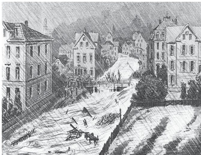
Bild 3. Zürcher Hochwasser 1878, an der Seefeldstrasse.

Gebiete auf der Alpensüdseite. Auf der Alpensüdseite werden mangels Differenzie-