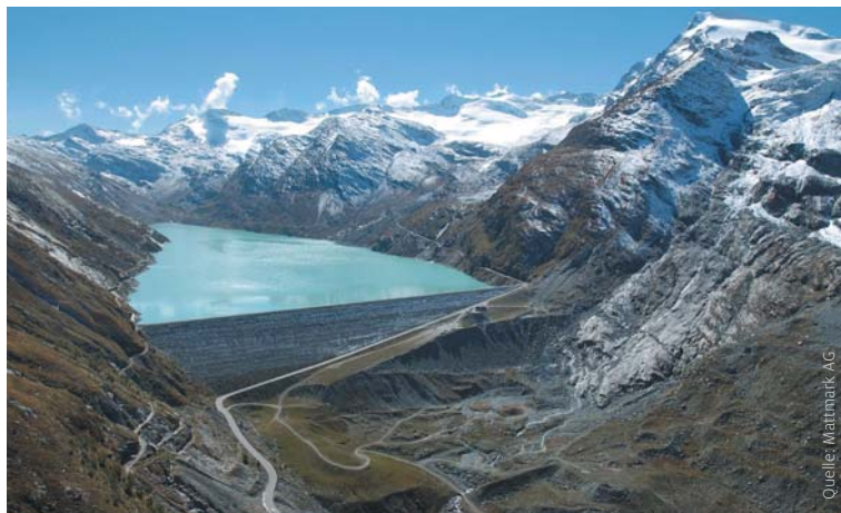
Beim Heimfall des Kraftwerks Mattmark könnte die Gemeinde Anlagen mit Ertragswert von 1,5 Millionen Franken pro Einwohner erhalten.

Dieser Vorgang wird als «Heimfall» bezeichnet und beschert den Gemeinwesen den Zugriff auf einen über Jahrzehnte aufgebauten Anlagewert von geschätzten 40 Milliarden Franken. Kantone und Gemeinden können dann vollumfänglich über ihre Wasserressourcen und die Anlagen verfügen und die heimgefallenen Werke zurückbauen, selbst betreiben oder die Konzession wieder neu verleihen.